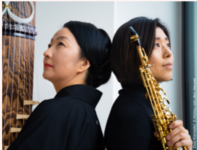
Duo Kanadé