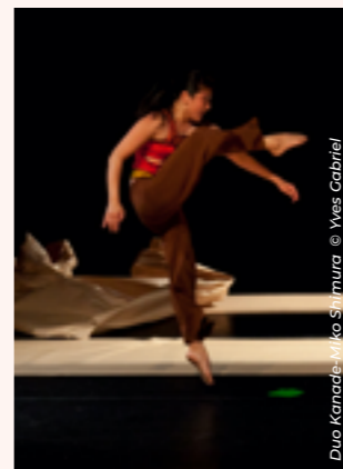
Duo Kanadé - Miko Shimura