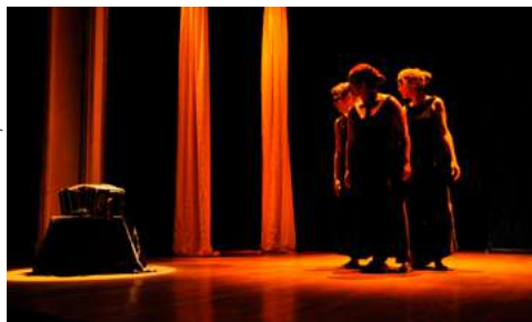
© Las Estumelinks - la tropa

EN The Asmara-Addis Literary Festival (In Exile) was founded in Brussels in 2019 by Eritrean-Ethiopian British author Sulaiman Addonia. It aims to reflect & celebrate our societies not as censored but as they exist, with all their diversities, troubles, and beauty. Theme of this edition: Say It Loud - An Exploration of the Art of Unsubtlety. In collaboration with Bozar and Passa Porta. 📍 Théâtre Mercelis, Théâtre Molière & rues/straten/streets Ixelles/Elsene