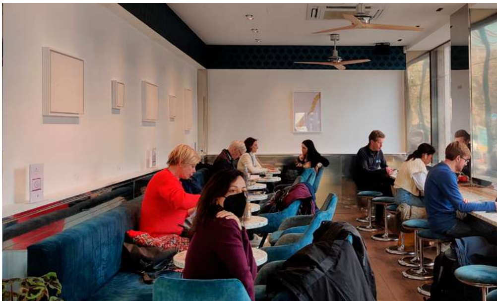
Renew Art Gallery © Kim Cappart, expo Francesco Strizzi

Read the full article in English on culture.ixelles.be !